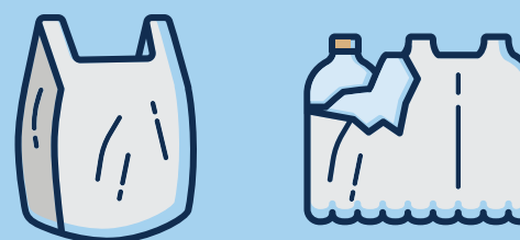
Films et sacs en plastique · Plastikfolien und -tüten · Plastic films and bags