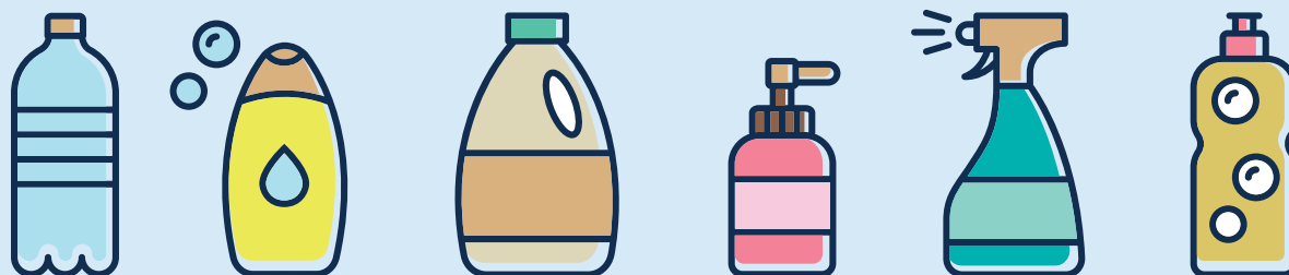
Bouteilles et flacons en plastique · Plastikflaschen und -flakons · Plastic bottles and containers