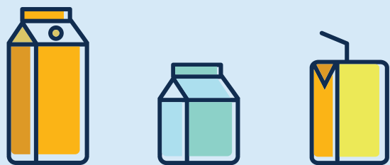
Cartons à boisson · Getränkekartons Beverage cartons