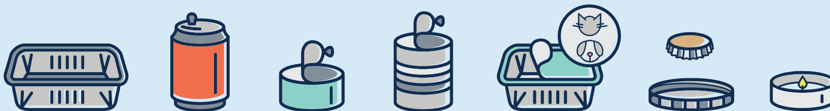
Emballages métalliques · Metallverpackungen · Metal packaging