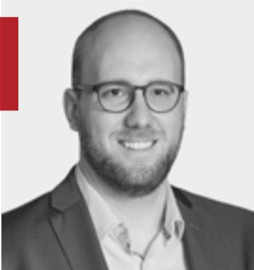
Yuri De Smet ( bourgmestre )