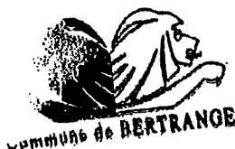
Monique SMIT - THIJS

Bertrange, le 20/05/2022 Le Bourgmestre,