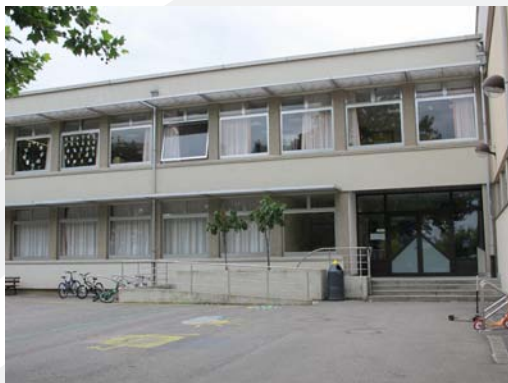
Salle 3, Hall polyvalent (près de la mairie)