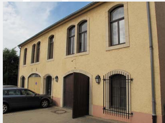
Schauwenburg, place de l'Eglise